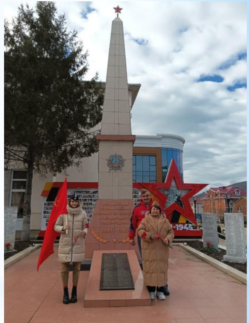
мемориал Героям, павшим в Великой отечественной войне