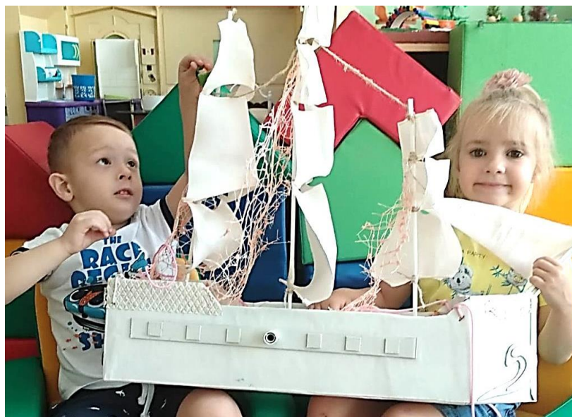
Сюжетно-ролевая игра "Моряки" детей 4-5 лет с ТНР