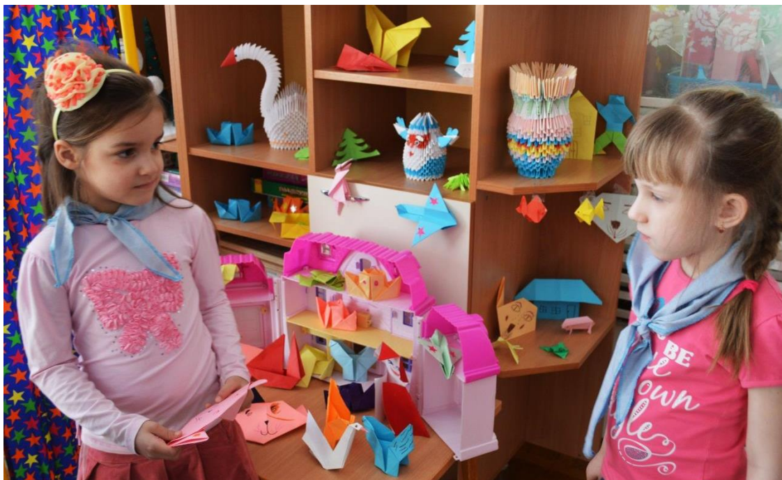
Творческая игра "Путешествие в страну Оригами" детей 6 лет с ТНР