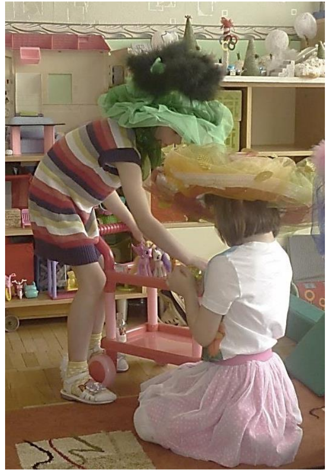
Творческая игра по мотивам сказки А.Волкова «Волшебник Изумрудного города» детей 6 лет с ТНР