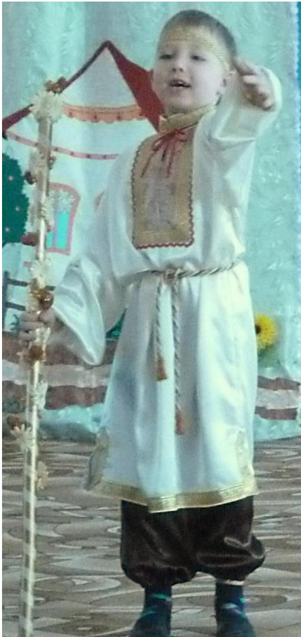
Театрализованная игра "Снегурочка" детей 6 лет с ТНР