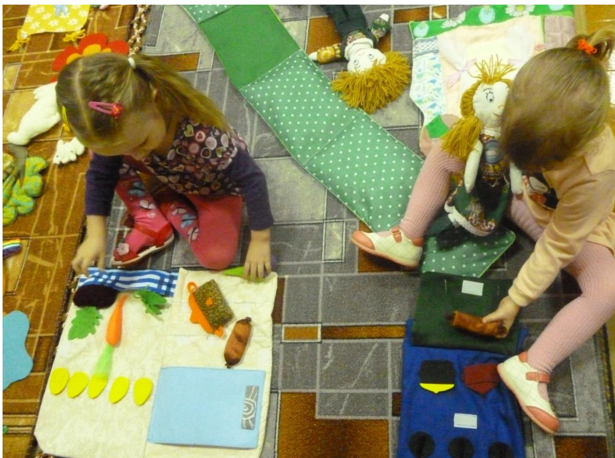
Сюжетно-ролевая игра "Семья" детей 4 лет с ТНР