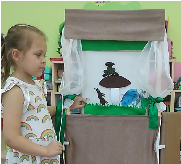
Подготовительный этап игры-инсценировки по сказке В.Сутеева "Под грибом" детей 4-5 лет с ТНР