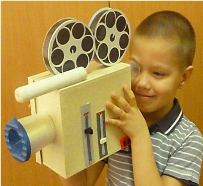
Сюжетно-ролевая игра "Киностудия" детей 6 лет с ТНР