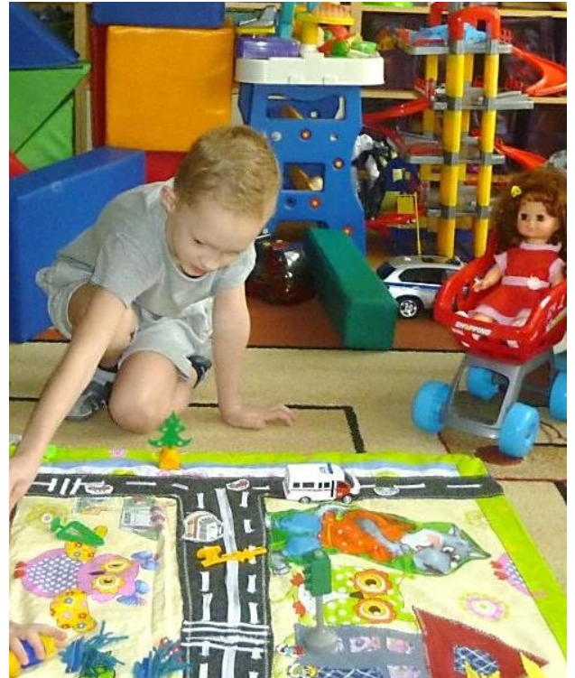
Сюжетно-ролевая игра "Город" детей 5-6 лет с ЗПР