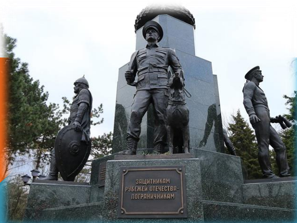
Сквер Пограничников с обелиском – памятником Защитникам Рубежей Отечества