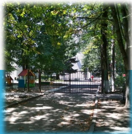
Детский сад №179