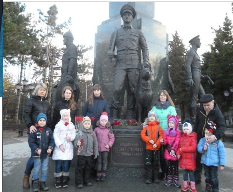
ВОЗЛОЖЕНИЕ ЦВЕТОВ К МЕМОРИАЛУ